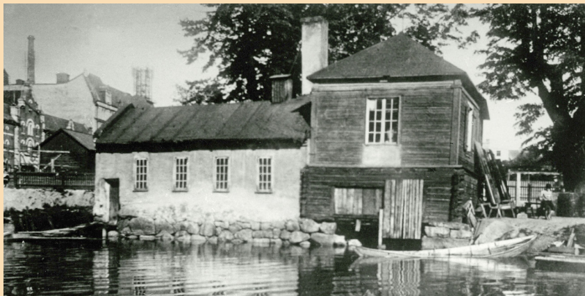
Lusthuset vid Lindhska boktryckerigården fanns kvar till början av 1900-talet men hade förlorat sin ursprungliga funktion. Här är huset ihopbyggt med ett senare uppfört bryggghus.