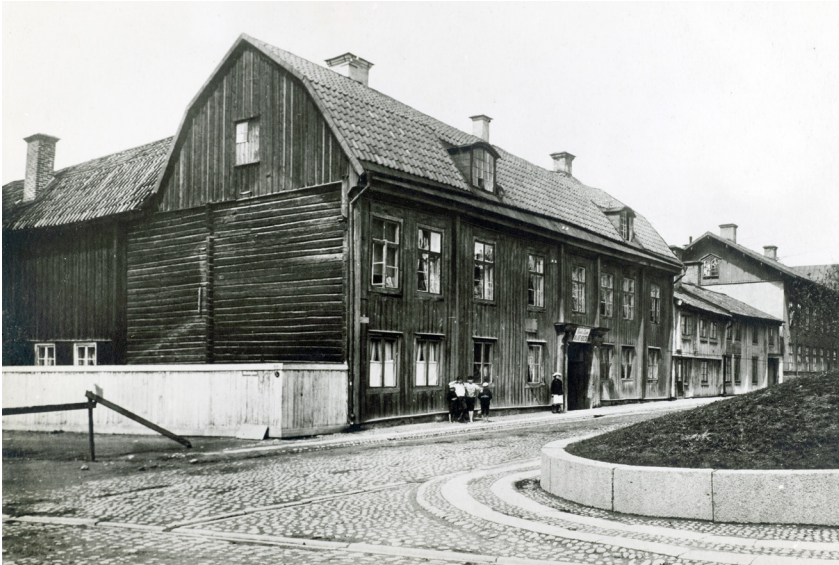
Den stora Lindhska boktryckerigården 1903. Den låg nedanför kyrkan med en tomt som sträckte sig ända ner till Svartån. Gården revs 1910 för att lämna plats för post- och telegrafverkets byggnad.

deltog aktivt då detta var något utöver det vanliga sällskapslivet i staden där »blott dans och kortspel ingå«. Vid den första sammankomsten den 28 oktober 1849 inledde Hedlund med en lång prolog varefter husarkårens hela »Musikkorps« föll in med Webers jubelouvertyr. Därefter spelade bland andra Berens flera violin- och pianostycken, men det blev också deklamerande av Elias Wilhelm Rudas komiska poem samt sång och dans under kvällen som slutade vid elvtiden.