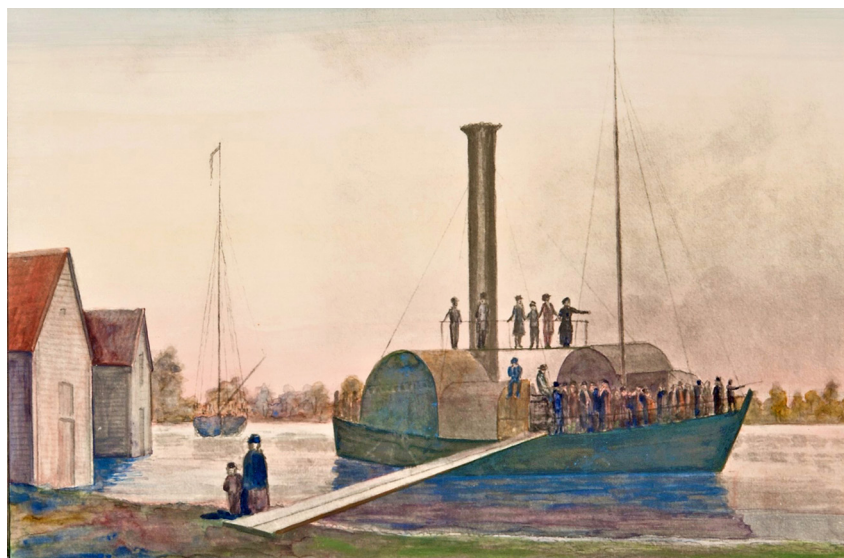
Skebäcks hamn fredagsaftonen den 19 juni 1846. Tuschlavering av prostén Johan Gustaf Schultz (1787–1874). Intill hamnen låg vid denna tid ett populärt värdshus med en tillhörande danspaviljong – senare ofta kallat Norensbergs värdshus.