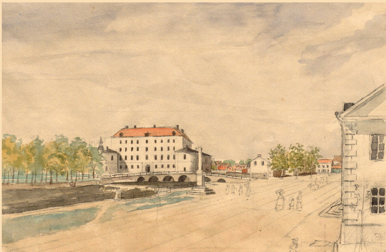
Örebro slott sett från »Översteleutnant Löwenborgs fönster«. Akvarell av Erik Westerling (1819–1857). Uppsala universitetsbibliotek.