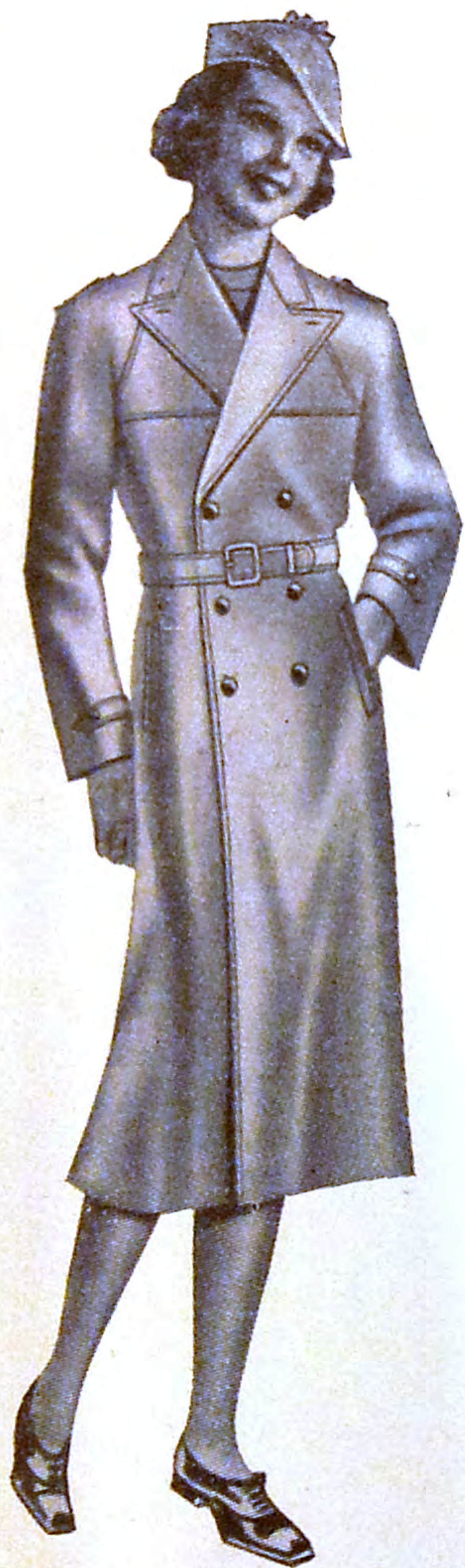
N:r 68B Flicktrenchcoat