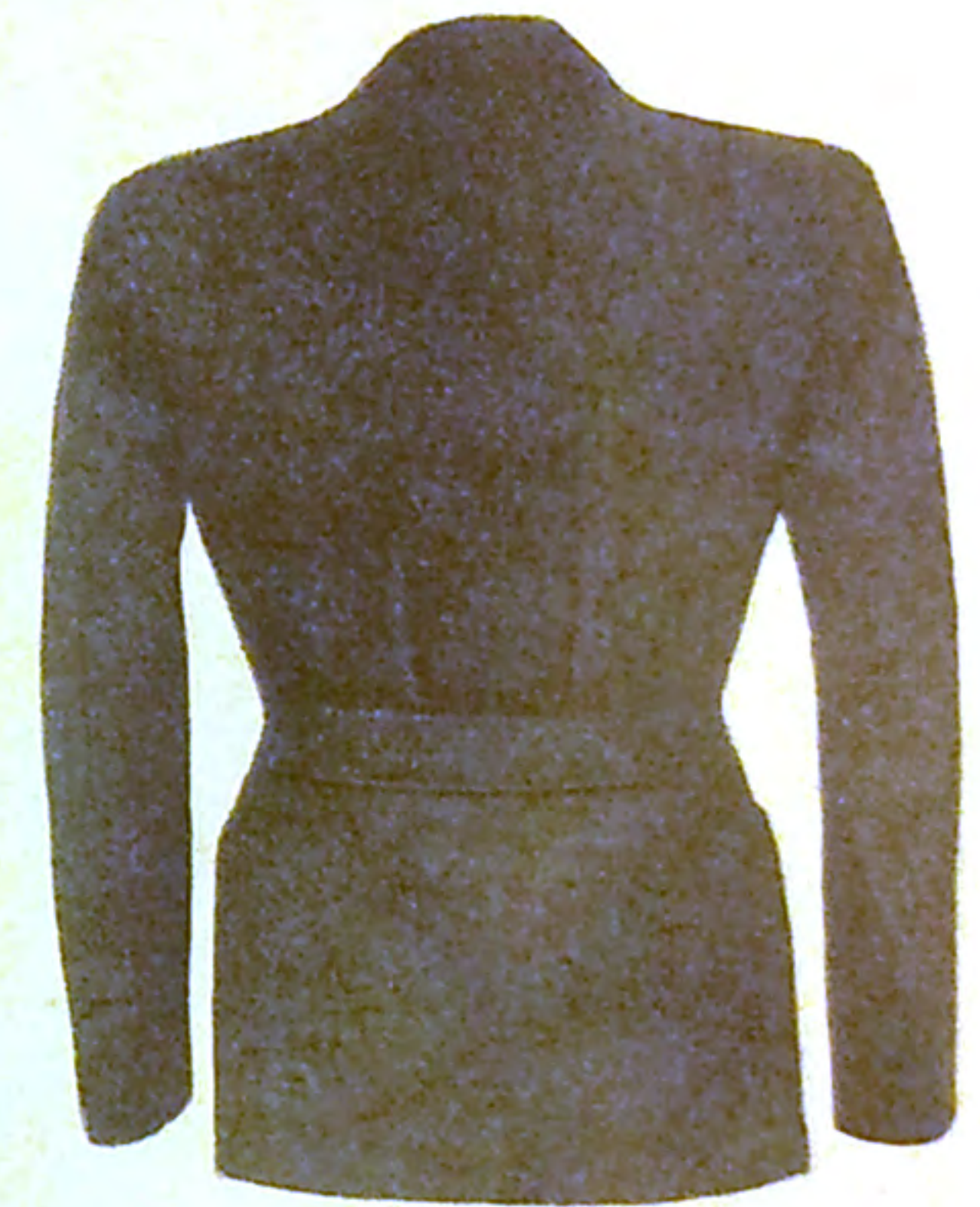
Fotoavbildning n:r 4860 Kavajrygg

N:r 4860 Golfkostym bestående av kavaj och golfbyxor.