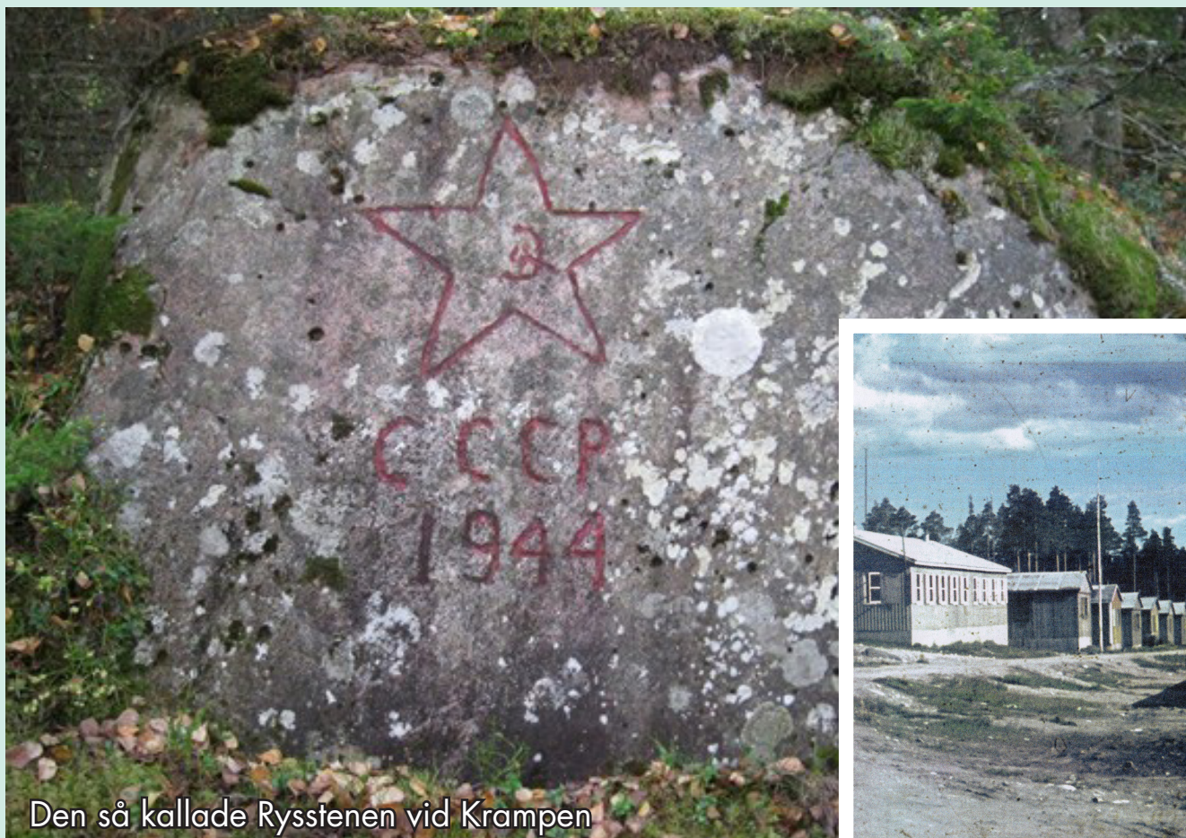
Den så kallade Rysstenen vid Krampen